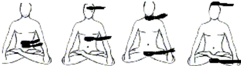
FIG. 17 Ombligo FIG. 18 3° Ojo Y Plexo FIG. 19 Chakras garganta y sacro FIG. 20 Chakras. corona y chakra base