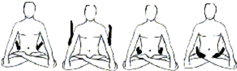
FIG. 13 Lados Riñones. FIG. 14 Codos FIG. 15 Caderas FIG. 16 Pelvis