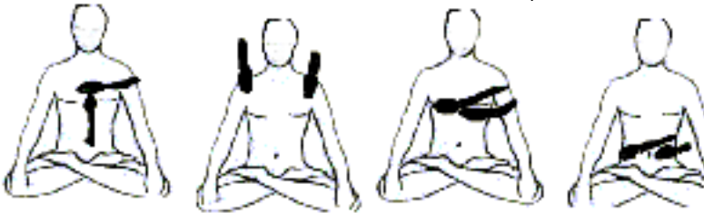
FIG. 9 Corazón FIG. 10 Hombros FIG. 11 Parte Inferior caja torácica FIG. 12 cintura