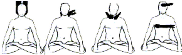
FIG. 5 Detrás Occipitales FIG. 6 Cervicales FIG. 7 Garganta y clavículas FIG. 8 3° Ojo y pecho derecho